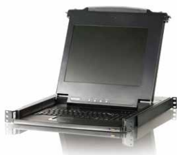
LCD控制端 CL1000 x 5