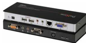
USB KVM信号延长器 CE770 x 68