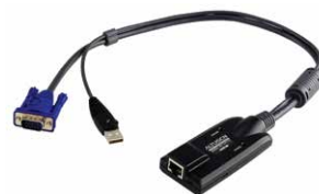
USB电脑端模块 KA7175 x 80