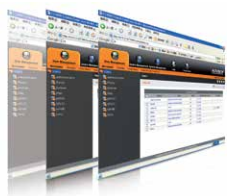
Control Center Over the NET™ 管理软件 CC2000 x 1