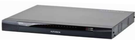
KVM over IP远程电脑管理方案 KN4116v x 5